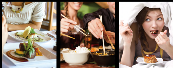
油っこい食事に 外食や会食の席に 甘い物や間食の前に